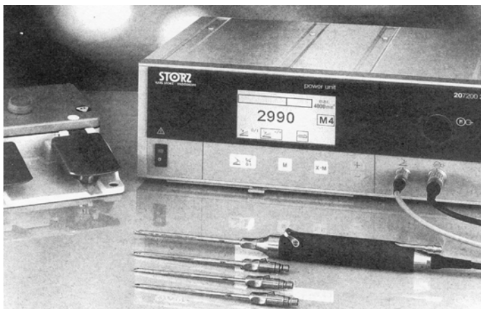
Instrumento motorizado para la realización de cortes, fresado y afeitado de la superficie articular por artroscopia.

Nosotros hemos observado que el factor edad no constituye un elemento que define un mal pronóstico basados en los resultados hallados en nuestro estudio. De igual modo la evolución general no ha estado paralelamente en función de dicho factor edad y pacientes ancianos y menos ancianos, han tenido una pronta recuperación e incorporación a la vida diaria. Otros factores consideramos han sido más influyentes en ese sentido. La obesidad ha constituido un factor de mal pronóstico evolutivo de manera que ha influido en dilaciones en la recuperación de la articulación