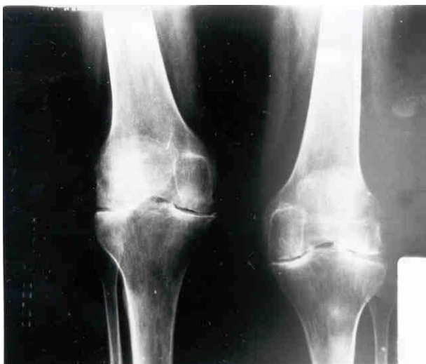
Rayos X simple de rodillas (vista AP). Se observa un marcado estrechamiento del espacio articular bicompartimental por cambios degenerativos avanzados. Esta fase radiológica constituye una contraindicación relativa para el abordaje terapéutico por artroscopía.

cisamente fue la interrogante que se planteó y analizó Checa González en uno de sus trabajos (30). Concordamos con sus interesantes criterios pues más allá de tratarse de un elemento clínico, debe evaluarse como un fenómeno anatómo-patológico descriptivo de un daño articular del cartílago en el cual la fibrilación el reblandecimiento y fisuración del cartílago difícil de separar del proceso degenerativo en sí mismo y conducente a la exposición del